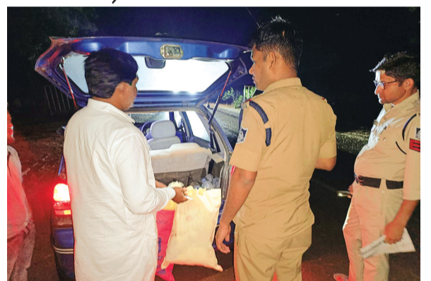
हरिभूमि न्यूज टीकमगढ़

जिले में सड़क सुरक्षा और कानून-व्यवस्था को और अधिक मजबूत बनाने के उद्देश्य से पुलिस सख्त नियमों पर सख्ती चलाया जा रहा है। पुलिस अधीक्षक मनोहर सिंह मंडलोई के निर्देशन में संचालित इस अभियान के तहत यातायात नियमों के पालन के साथ-साथ सड़क सुरक्षा एवं अवेधानिक गतिविधियों पर प्रभावी नियंत्रण स्थापित करने पर विशेष जोर दिया जा रहा है।