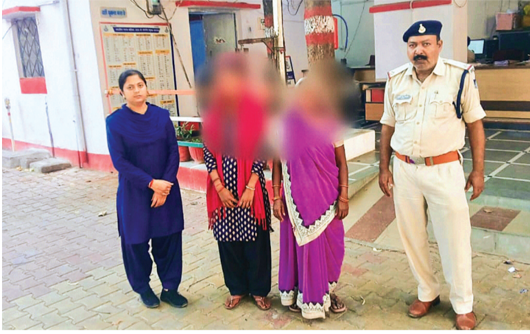
हरिभूमि न्यूज टीकमगढ़