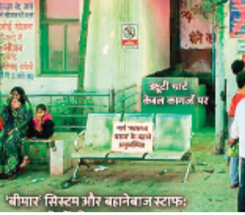
हरिभूमि न्यूज अशोकनगर

वीआईपी कल्चर तो बीमारी का बहाना, ड्यूटी से किनारा अस्पताल प्रबंधन द्वारा नियमानुसार ड्यूटी चाट तैयार किया जाता है, जिसमें दिन और रात की शिफ्ट तय होती है। नियम कहता है कि यदि कोई कर्मचारी दिन में तैनात है, तो उसकी रात की ड्यूटी नहीं होगी। लेकिन चंदेरी सिविल अस्पताल में इन नियमों को ताक पर रख दिया गया है। कर्मचारी अपनी सातगांठ और सुविधा के अनुसार शिफ्ट बदल लेते हैं, जिससे पूरी स्वास्थ्य व्यवस्था चरमरा गई है। केवल ड्यूटी के समय ही याद आती है। हकीकत में यह केवल काम से बचने का एक जरिया बन चुका है, जिसके कारण अस्पताल में तैनात अन्य स्टाफ पर बोझ बढ़ता है और मरीजों को घंटों तक बिना उपचार के तड़पना पड़ता है। साथ ही जानकारी के अनुसार, अस्पताल का कुछ स्टाफ तो