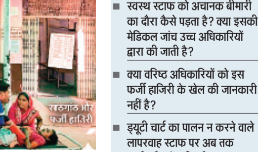
हरिभूमि न्यूज अशोकनगर

खास बातें ■ स्वस्थ स्टाफ को अचानक बीमारी का दौरा कैसे पड़ता है? क्या इसकी मेडिकल जांच उच्च अधिकारियों द्वारा की जाती है? ■ क्या वरिष्ठ अधिकारियों को इस फर्जी हाजिरी के खेल की जानकारी नहीं है? ■ ड्यूटी चाट का पालन न करने वाले लापरवाह स्टाफ पर अब तक कार्रवाई क्यों नहीं हुई? ■ मरीजों की जान से खेलने वाले इन मनमानी के मालिक कर्मचारियों पर लगाम कौन कसेगा? चंदेरी सिविल अस्पताल की यह गिरती व्यवस्था स्वास्थ्य विभाग की कार्यशैली पर एक बड़ा प्रश्न चिह्न लगाती है। यदि जल्द ही इस लापरवाह स्टाफ पर सख्त कार्रवाई नहीं की गई और व्यवस्थाओं को पारदर्शी नहीं बनाया गया, तो अस्पताल की यह दिशा की लकीरें किसी दिन बड़ी अनहोनी का सबब बन सकती हैं। नगरविकास अथ जिला प्रशासन और स्वास्थ्य विभाग से इन मामलों में हस्तक्षेप कर सुधार की मांग कर रहे हैं।