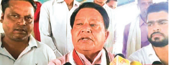
हरिभूमि न्यूज अशोकनगर

जिला किसान कांग्रेस कमेटी अशोकनगर द्वारा शनिवार को पुरानी गल्ला मंडी, अशोकनगर में आयोजित प्रकरणा वार्ता में किसानों की ज्वलंत समस्याओं को लेकर सरकार की नीतियों पर कड़ा विरोध दर्ज कराया गया। इस दौरान वक्ताओं ने स्पष्ट कहा कि वर्तमान सरकार किसानों के मुद्दों पर पूरी तरह असंवेदनशील है। लगातार गलत नीतियों और प्रशासनिक अव्यवस्था के कारण अन्नदाता आर्थिक संकट में फंसा हुआ है, लेकिन सरकार केवल दिखावटी