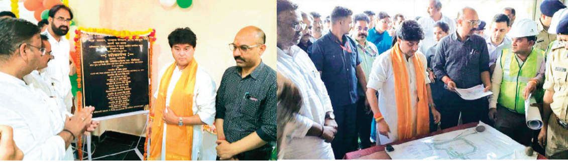
हरिभूमि न्यूज अशोकनगर

केंद्रीय संचार एवं पूर्वोत्तर क्षेत्र विकास मंत्री एवं क्षेत्रीय सांसद ज्योतिरादित्य सिंधिया द्वारा शनिवार को जिला मुख्यालय अशोकनगर स्थित 795.82 लाख रुपये से बने नवनिर्मित संयुक्त तहसील कार्यालय भवन अशोकनगर का लोकार्पण कर आमजन के लिए समर्पित किया। संयुक्त तहसील भवन के बन जाने से आमजन के राजस्व कार्यों में गति आयेगी। साथ ही कार्यालय में बेहतर सुविधाएं आमजन को मिल सकेंगी। अभी तक यह भवन पुराने तहसील कार्यालय में चल रहा था।